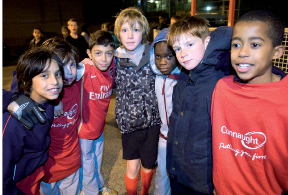
Hackney Homes tarafından başlatılan yeni girişimlerden biri olan Kickz Futbol Programı gençlere futbolu uzmanlardan öğrenme şansı veriyor

Konut Sakinlerinin Hackney Homes'un iletişim ve bilgilendirme girişimleri konusunda verdikleri yanıtlar da teşvik edici olup konut sakinlerinin %70'i Hackney ile ilgili son gelişmelerden haberdar edilerek iyi bilgilendirildiklerini