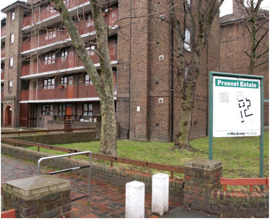
Siterimizden biri 'For Sale' [Satılık] ilanlarının kaldırılmasıyla daha güzel bir görünüme kavuştu.

Büyük bir etnik çeşitliliğe sahip olan Hackney'deki toplumlara mükemmel hizmetler sağlanması Hackney Homes'un gerçekleştirmeyi amaç edindiği bir hedefdir.