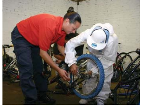
Kuzey Doğu Bisiklet Projesinde gençler eski bisikletleri yeniliyorlar.