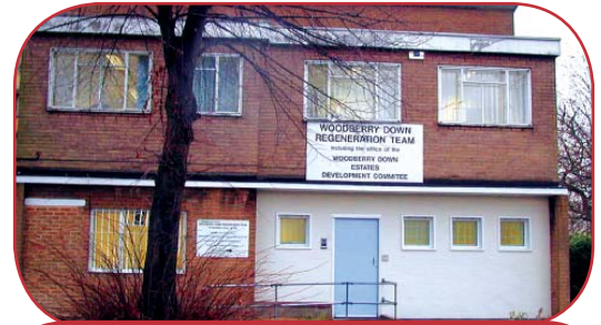
151 Woodberry Grove Woodberry Down İyileştirme Ofisi

Ofisimiz 151 Woodberry Grove adresindedir, ve istediğiniz zaman ziyaret edip bizimle görüşebilirsiniz. Şubat ayından itibaren site içinde ve dışında çalışmalar yürüteceğiz ve diğer konular yanında tasarımın görsel etkisi ve sitenin düzenlemesi konusunda sizinle görüş alışverişinde bulunacağız.