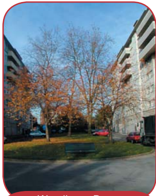
Woodberry Down konutliri

Ocak ayından itibaren Woodberry Grove North'tan Bewdley, Rowland, Ombersley, Dean, Wychwood, Duffield Whittlebury sakinleri için geçici mesken sağlama işlemlerine başlanacaktır. Bu bölgelerdeki aileler Woodberry Down sitesinin diğer kısımlarında yeniden tefriş edilmiş konutlara aktarıldı.