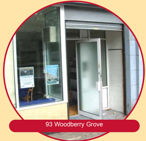
93 Woodberry Grove

Woodberry Down için Bağımsız Kiracılar ve Finansal Kiracılar Danışmanı (Independent Tenants and Leaseholder Advisor - ITLA) atanmıştır ve sakinlere bağımsız tavsiyelerde bulunmak için EDC ile yakın işbirliği yapacaktır. Çalışma yerleri 93 Woodberry Grove'dadır. Sakinler her Salı ve Perşembe öğleden sonra saat 3 ile akşam saat 7 arası randevu gerekmezsiniz bürolarında onları ziyaret edebilirler. Ayrıca isterseniz 020 8809 7203 numaraya telefon edip, size uygun bir zamanda büroda görüşme veya evinizde ziyaret için randevu alabilirsiniz.