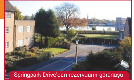
Springpark Drive'dan rezervuarın görünüşü

Toplantı tutanaklarının kopyaları Yenileme B ü r o s u n d a n (Regeneration Office) alınabilir.