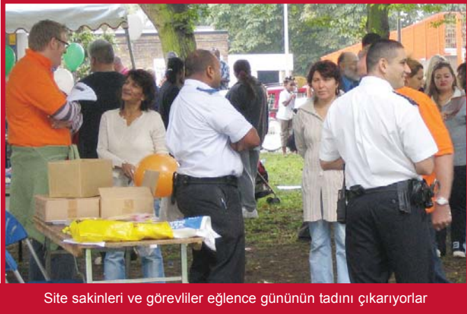
Site sakinleri ve görevliler eğlence gününün tadını çıkarıyorlar

Bu yıl yapılan bu etkinliğin başarısına dayanarak gelecek yıl bunun bir benzerini daha düzenlemeyi ümit ediyoruz. Bundan sonraki etkinlik için fikirleriniz ve önerileriniz varsa, lütfen hiç çekinmeden bize yazın. Adres arka sayfada.