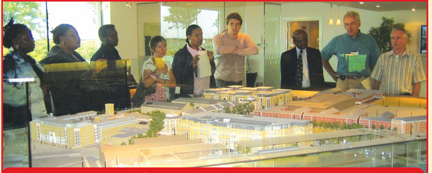
Site sakinleri yapılan diğer konutları inceliyorlar

Ayrıca, yazılı başvuruları değerlendiren ve ön elemeyi geçmiş konsorsiyumlar ile görüşmeleri yapan seçici kurulda üç EDC üyesi de bulunuyordu. Seçim sürecini sonuçlandırmak üzere, son teklifler değerlendirilerek konsorsiyumlardan hangisinin Woodberry Down'da en kaliteli konutları en ekonomik bir şekilde yapabileceği belirlenecek. Son kararın Belediye Kabinesi tarafından Kasım sonuna doğru alınması bekleniyor.