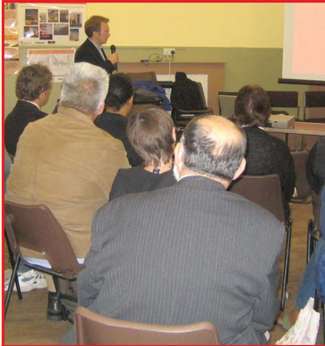
Nâzım Plan Atölyelerine katılan site sakinleri