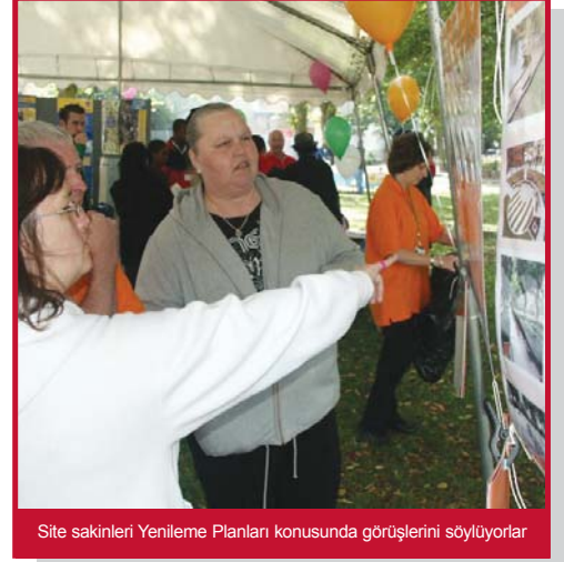
Site sakinleri Yenileme Planları konusunda görüşlerini söylüyorlar

Bir komedyen ikilisi çeşitli numaralar ve sihirbazlıklar, yüz boyama, zıplama kalesi ve Playbus ile çocukları eğlendirip çöpler ve çevre hakkında eğitirken; anne babalar da Sağlık