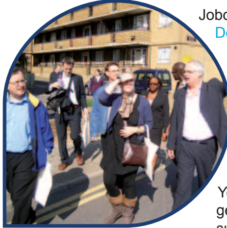
Üstte: GLA yetkilileri Woodberry Down'ı gezerken

Ayrıca ziyaret, yetkililerin Woodberry Down Regeneration projesi hakkında daha detaylı bilgi alması ve Woodberry Works inşaat eğitimi tesisi gibi inisiyatifleri görmesi için bir fırsat oluşturdu.