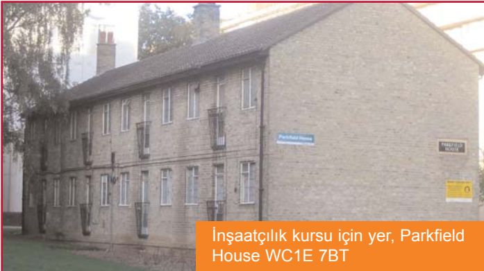
İnşaatçılık kursu için yer, Parkfield House WC1E 7BT

Bu projenin gerçekleştirilmesi için Hackney Community College ile İmar ve Yenilenme Ekibi işbirliği yapıyordu. Ekibin amacı, yılda 120'den fazla kişiye eğitim verip kurs sırasında ve sonrasında tam destek sağlamak.