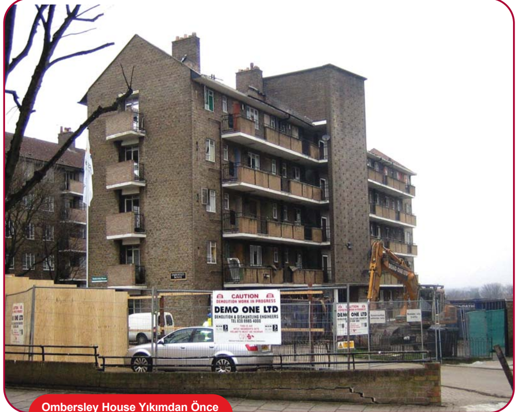
Ombersley House Yıkımdan Önce Ombersley House Yıkımdan Sonra

Yıkım çalışmasına hazırlanırken Whittlebury House güvenli bir yer haline getirilip içerideki bütün tesisat ve mefruşat (radyatörler vb) sökülüp çıkarıldı.