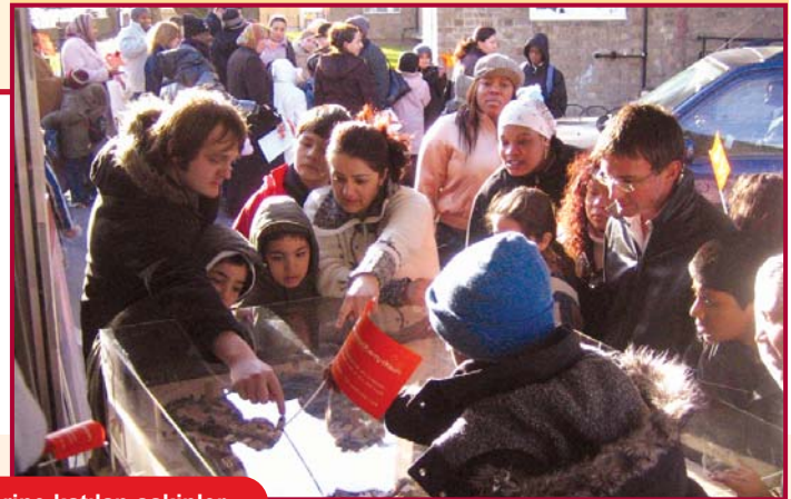
Tanıtım Turu etkinliklerine katılan sakinler