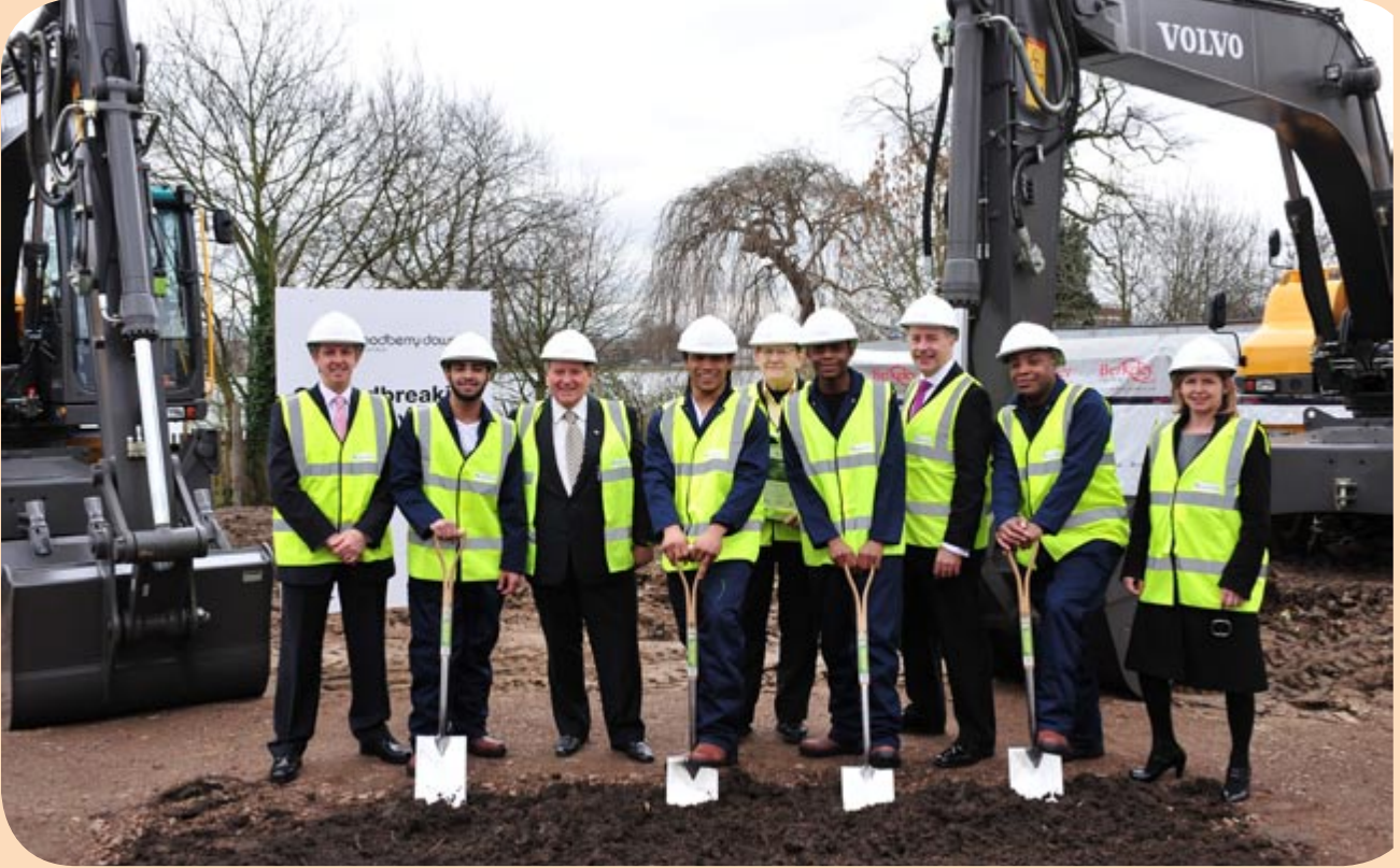
Yukarı: Ana ortaklar Woodberry Çalışmaları stajyerleri ile birlikte.