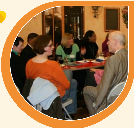
Sağ: Genesis Ekip üeleri sakinlerle birlikte.