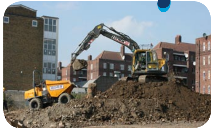
Yukarı: Eski Okul Arazisinde yıkım çalışması.