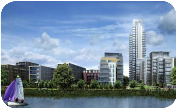
Yukarı: Eski Okul Arazisinin mimari görüntüsü.

Gelecek ayın haber bülteninde Berkeley Homes'dan Eski Okul Arazisinde gelişmelerini takip edebilirsiniz.