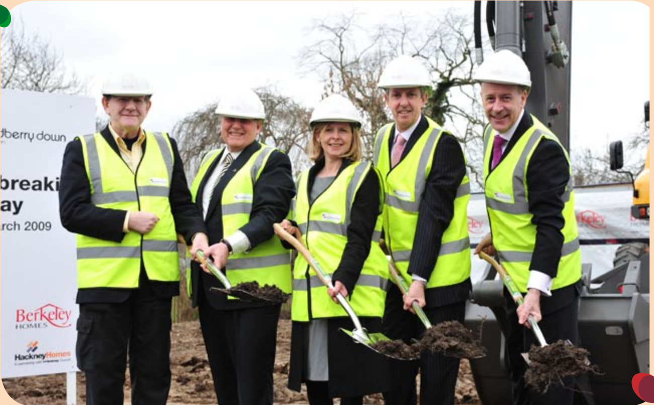
Yukarı: Ana ortaklar Eski Okul Arazisi inşaatının başlamasını kutluyorlar.