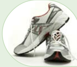
Sağda: Parkta sağlıklı yürüyüşler