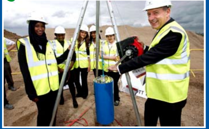
Belediye Başkanı Jules Pipe, Skinner's 'Kız' Okulundan öğrencilerle birlikte.

Learning Trust, 14 Temmuz günü, Yeni Skinner's Akademisinin sahasında bir zaman kapsülü yerleştirme etkinliğine ev sahipliği yaptı. Burada amaç, Akademisinin gelişiminde yeni bir evre olan temel işlemlerinin bitişi ve çelik konstrüksüyon işlerinin başlamasını belirlemektir. Kapsülün amacı gelecek kuşaklara 2009'da Hackney'deki yaşam hakkında bilgi vermektir, kapsül bundan on yıllar ya da yüzyıllar sonra bulunabilir.